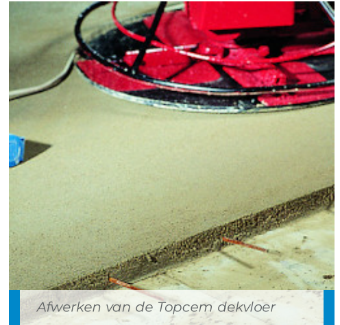
Afwerken van de Topcem dekvloer