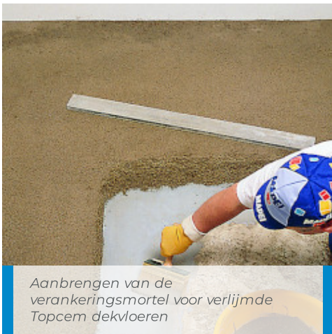
Aanbrengen van de verankersmortel voor verlijmde Topcem dekvloeren