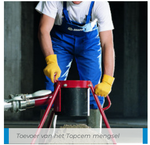
Toevoer van het Topcem mengsel