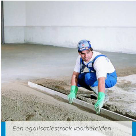
Een egalisatiestrook voorbereiden