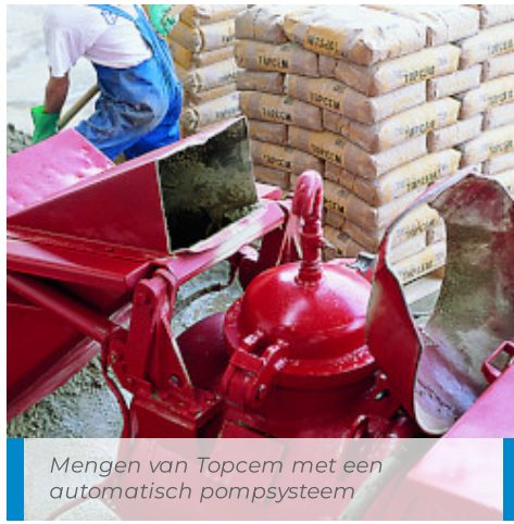
Mengen van Topcem met een automatisch pompsysteem